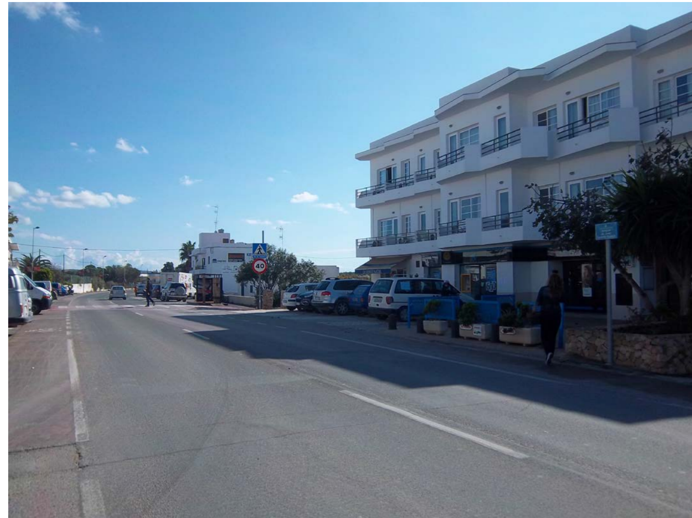
VISTA ESTADO ACTUAL, DIRECCIÓN LA MOLA