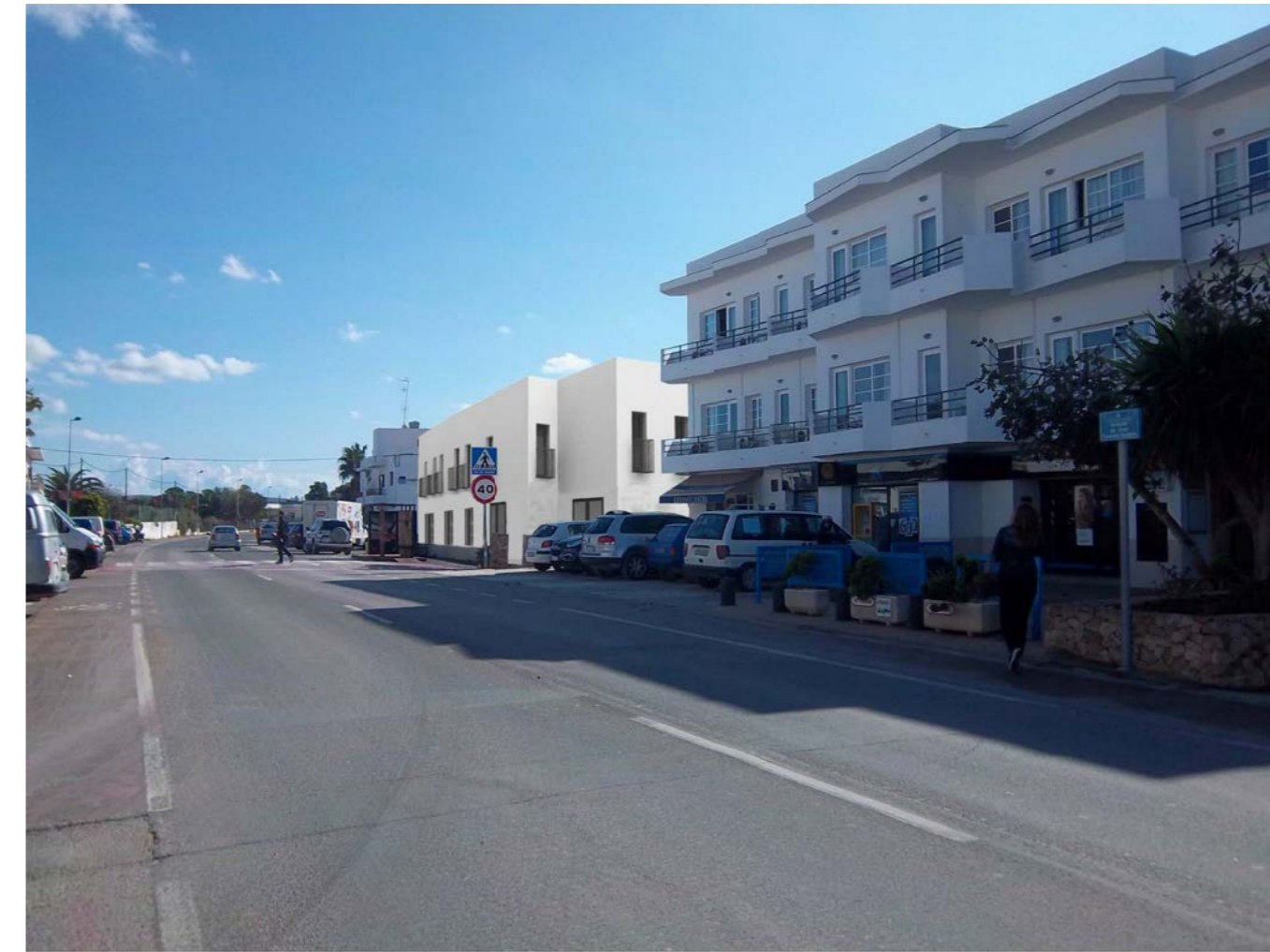
VISTA PROPUESTA, DIRECCIÓN LA MOLA