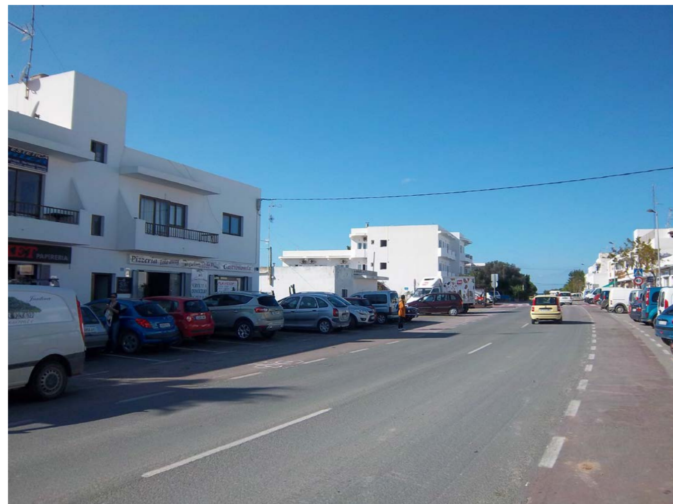
VISTA ESTADO ACTUAL, DIRECCIÓN SANT FRANCESC