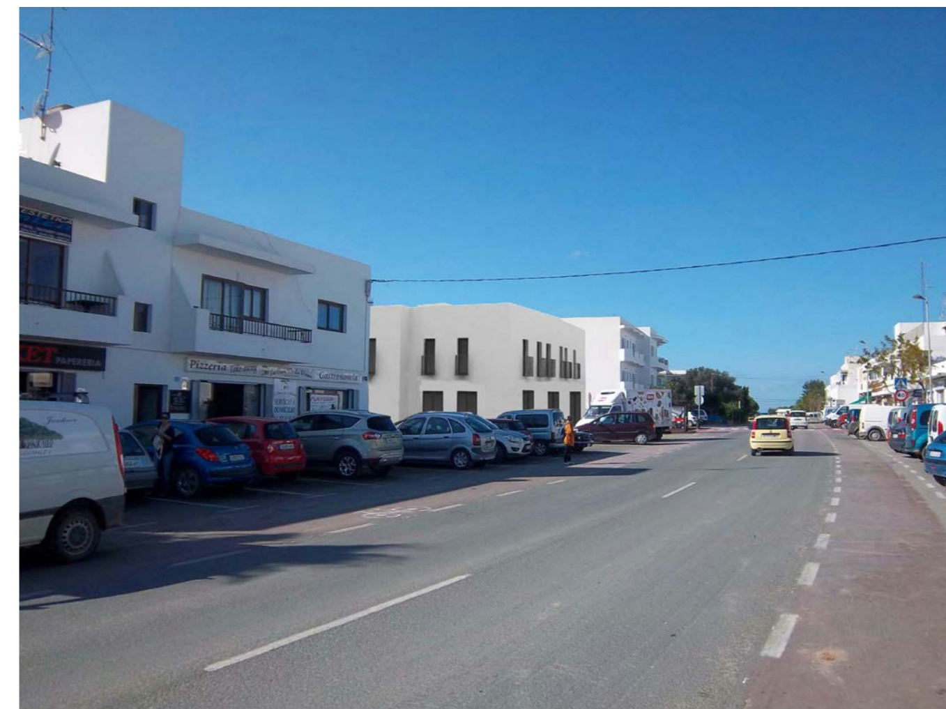
VISTA PROPUESTA, DIRECCIÓN SANT FRANCESC

CUMPLE EL ART. 40 DEL REGLAMENTO DE GESTIÓN URBANÍSTICA Y EL ART. 84 DE LAS NNSS DE FORMENTERA